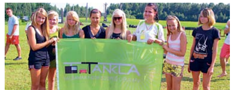
Valgamaa noortekeskuste suvekooli korraldab 2011. aastal Otepää Avatud Noortekeskus, kes sai seniks enda valdusse ka maakondliku noorsootöö katuseorganisatsiooni Tankla lipu.

Noortele oli korraldatud tihe tegevuste graafik. Kahe päeva jooksul toimusid seiklusmängud, fotojaht, paintball, laagrilaulu konkurss ning impro