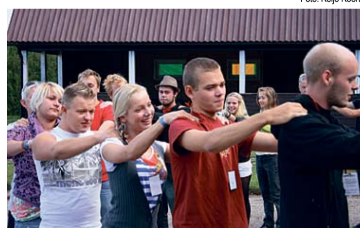
Viljandimaal toimunud noorteseinar "2010 Noored! Meie pärand - kas kultuur või subkultuur?" tõi kokku noored viiest Euroopa riigist.

Enne pimedat oli žürii sun- nitud mitme silmapaistva idee seast selle ühe parima välja valima. Seekord ostus pari- maks lahenduseks uue info ja kvaliteedi brändi „Elephant