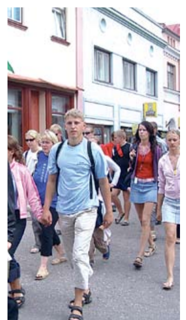
Rõuge Noorteklubi noored 2004. aastal Noortepäeval Pärnus. Pildi keskel (sinises) praegune vallavanem Tiit Toots.

Tema on andnud oma panuse eduka jalgpalliklubi loomisesse, aktiivse rattaklubi tegevusse, korraldas golfturniiri ning koordineerib Võrumaa Noorte Töõbõrsi ja videostudio tegevust.