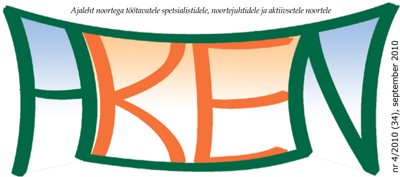
Eesti Noorteühenduste Liidu väljaanne