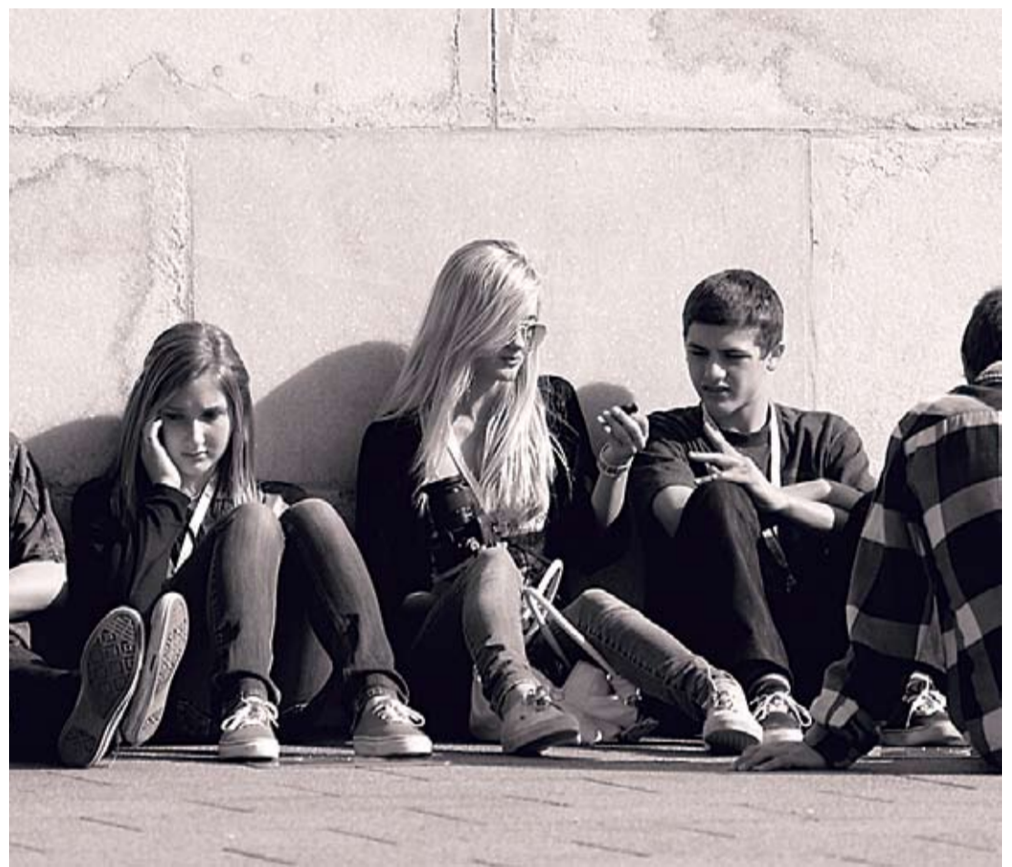
Võimalusi vabatahtliku tööga tegelemiseks on palju ja kunagi pole liiga hilja, et alustada. Tuleb vaid leida endale see, mis sobib.