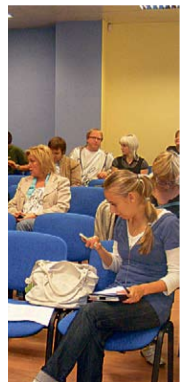
Koheselt Eesti Noorsootöö Keskusega sõlmitud lepingu järel on noortekeskuste katuseorganisatsioon hakanud läbi viima hanke infopäevi, neist esimene leidis aset 17. septembril Tallinnas.

Hanke tegevuste elluviimiseks soovitakse 2013. aasta 31. augusti seisuga kaasata 20 000 eesti noort.