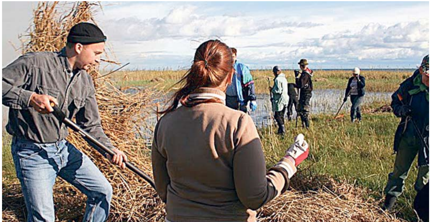
Eestimaa Looduse Fondi talgutega seotud vabatahtlike hulgas on ligi pooled kuni 26-aastased noored.

Usun, et kaugel pole ka see aeg, kui minu tegevusaastate alguses lastena osalenud noored ise lapsevanemad on, rollid muutuvad ja keegi neist teatavalt üle võtab, et oma laste, noorte vabaajale mõtlema hakata. Igatahes on algus tehtud, seeme mulda visatud. Mõnikord on just alustamine see kõige raskem. Nii oli see ka siis, kui 10 aastat tagasi meie alustasime, sest sõna "noortekeskus" oli paljudele võõras.