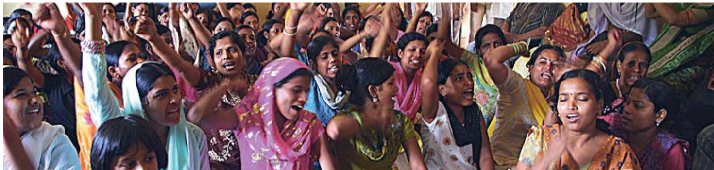
Noorte õiguste töötuba Lalitgiri külas, korraldajateks National Youth Project ja Jeevan Rekha Parishad.

Kui riiklikud koolid ei anna noortele nii palju vaba aja veetmise võimalusi, siis era-koolid pakuvad lõbustusi ja ka võimalusi spordiga tegeleda. Riiklike koolide lastele koonduvad kõik kõige olulisemad vaba aja veetmise võimalused kirikutesse.