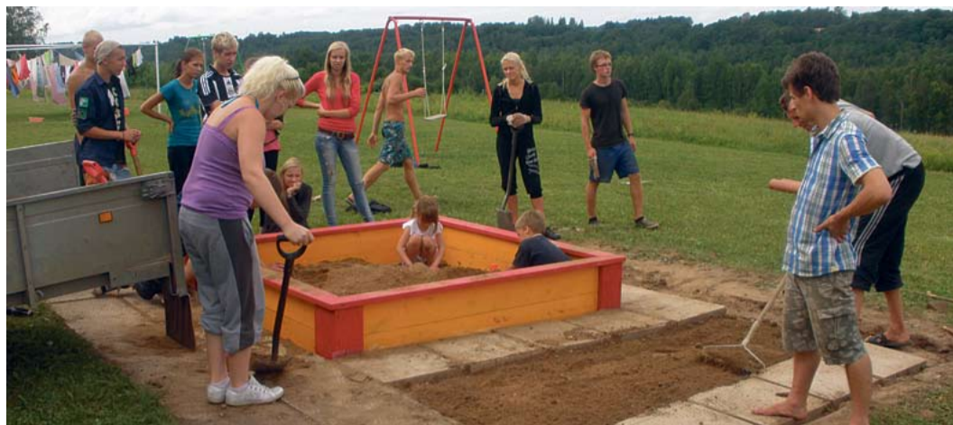
Vana-Võidu mudilased olid MAlgatuses raames korda tehtava mänguplatsi üle nii evelil, et ei suutnud isegi tööde lõppu ära oodata..