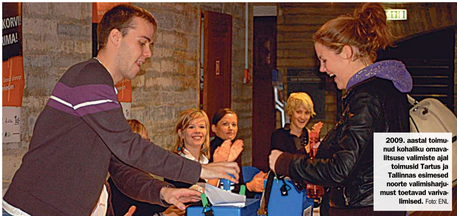
2009. aastal toimu- nud kohaliku omava- litsuse valimiste ajal toimusid Tartus ja Tallinnas esimesed noorte valimisharju- must toetavad variva- limised.

Projekti viiakse ellu prog- rammi Euroopa Noored toetusel noorte demokraa- tiaprojektide alaprogrammi raames.