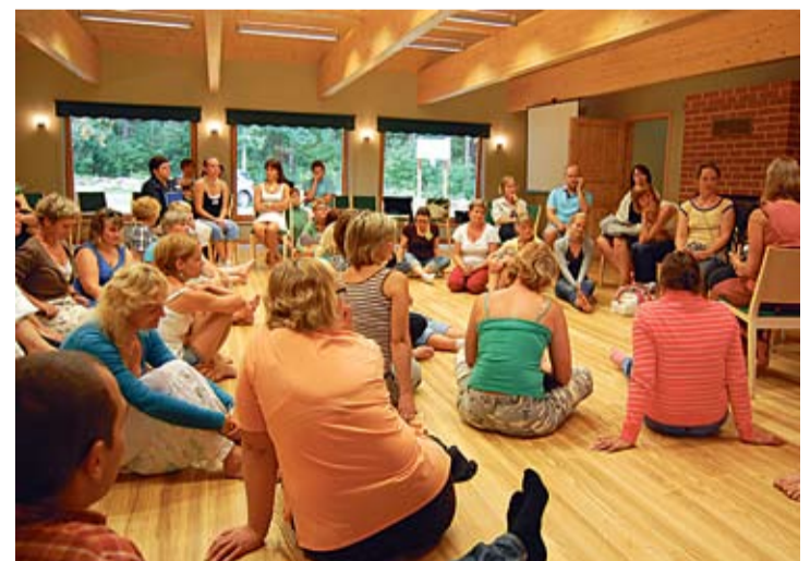
Kolme päeva jooksul said osalejad kuulata oma ala parimate loenguid ja kaasa lüüa ühistegevustes ning õpitubades. Nii korraldajad kui osalejad lugesid koolituse igati kordaläinuks.

Suveakadeemia läbiviimiseks tehti koostööd sihtasutus Archimedes Euroopa Noored Eesti bürooga. „ENEB oli tänuväärne partner, kes aitas meil