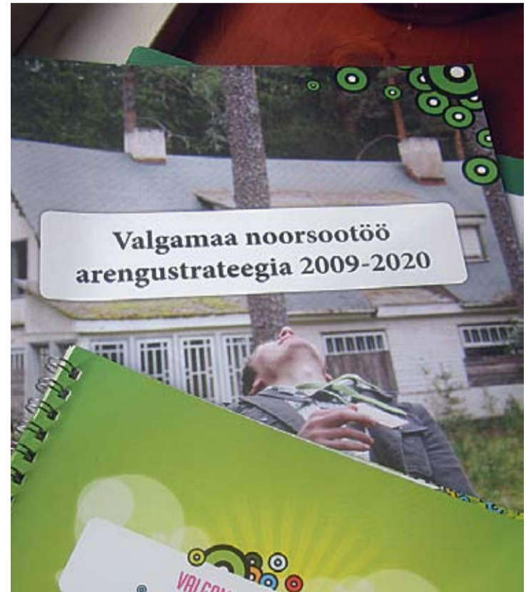
Kõige värskem, Valgamaa noorsootöö arengukava koostati kahes versioonis. Ametlik versioon on mõeldud omavalitsusjuhtidele ja noorsootöötajatele ja „Valgamaa noorte logiraamat aastani 2020“ seletab strateegia lahti noortele.

Eraldiseisvamatest dokumentidest on populaarsemad lühemaks ajaks, 4-5 aasta jaoks koostatud arengukavad, veidi vähem leidub pikemaajalisi strateegiad, mis hõlmavad 7-10 aastat. Puusepp leiab, et dokumendi nimi või ajaline kestus ei ole kõige olulisemad terminid: „Peaasi, et tege-