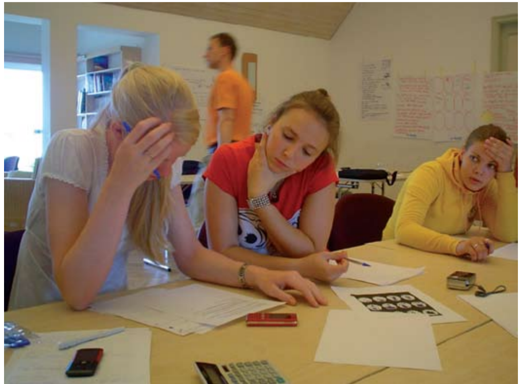
Järjepidev seksuaalharidus peaks koolidesse jõudma aastal 2011. Praegu peavad lapsevanemad ja noored selles osas toetuma eri organisatsioonide tegevusele.

Kohtumise eesmärgiks oli parimate praktikate vahetamine seksuaalhariduse valdkonnas. Esimese päeva alguses anti ülevaade nii Eesti kui ka Soome seksuaalhariduse arengutest, probleemidest ja väljakutsetest läbi aastate. Eesti eksperdid tutvustasid oma organisatsioonide tegevusi ja häid praktikaid. Teiste seas toodi välja nii internetinõustamist amor.ee veebilehel kui ka noorelt noortele koolitust, mida on seni väga edukalt läbi viinud MTÜ Living For Tomorrow. Soome kolleegidelt said Eesti eksperdid vaid kiita,