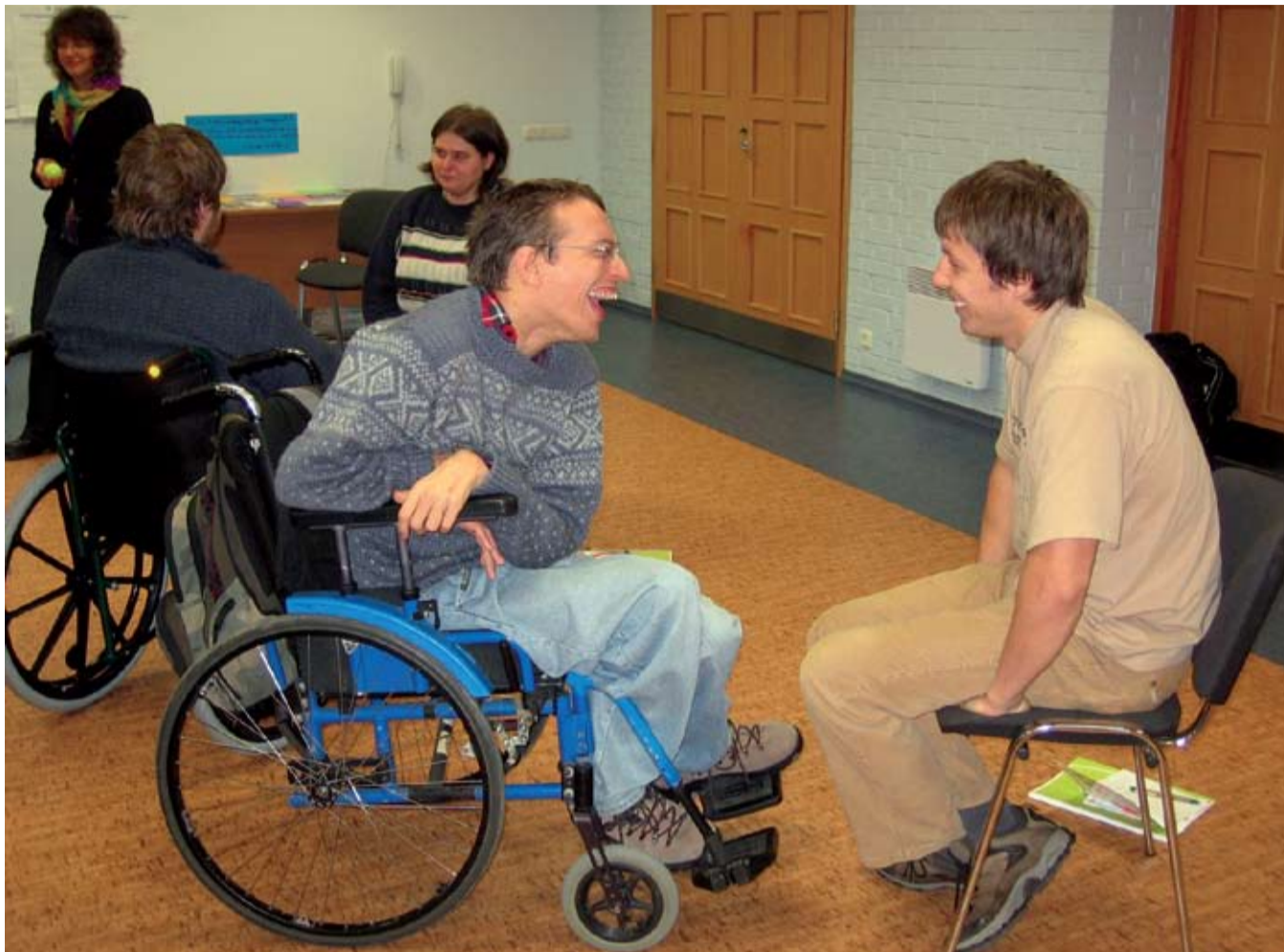
Noored kakskeelsel inimõiguste koolitusel 2007. aatstal: „Inimõigused meie elus ja noorsootöös”.

Koolitusele kandideerimine lõpeb 27.11.2009.