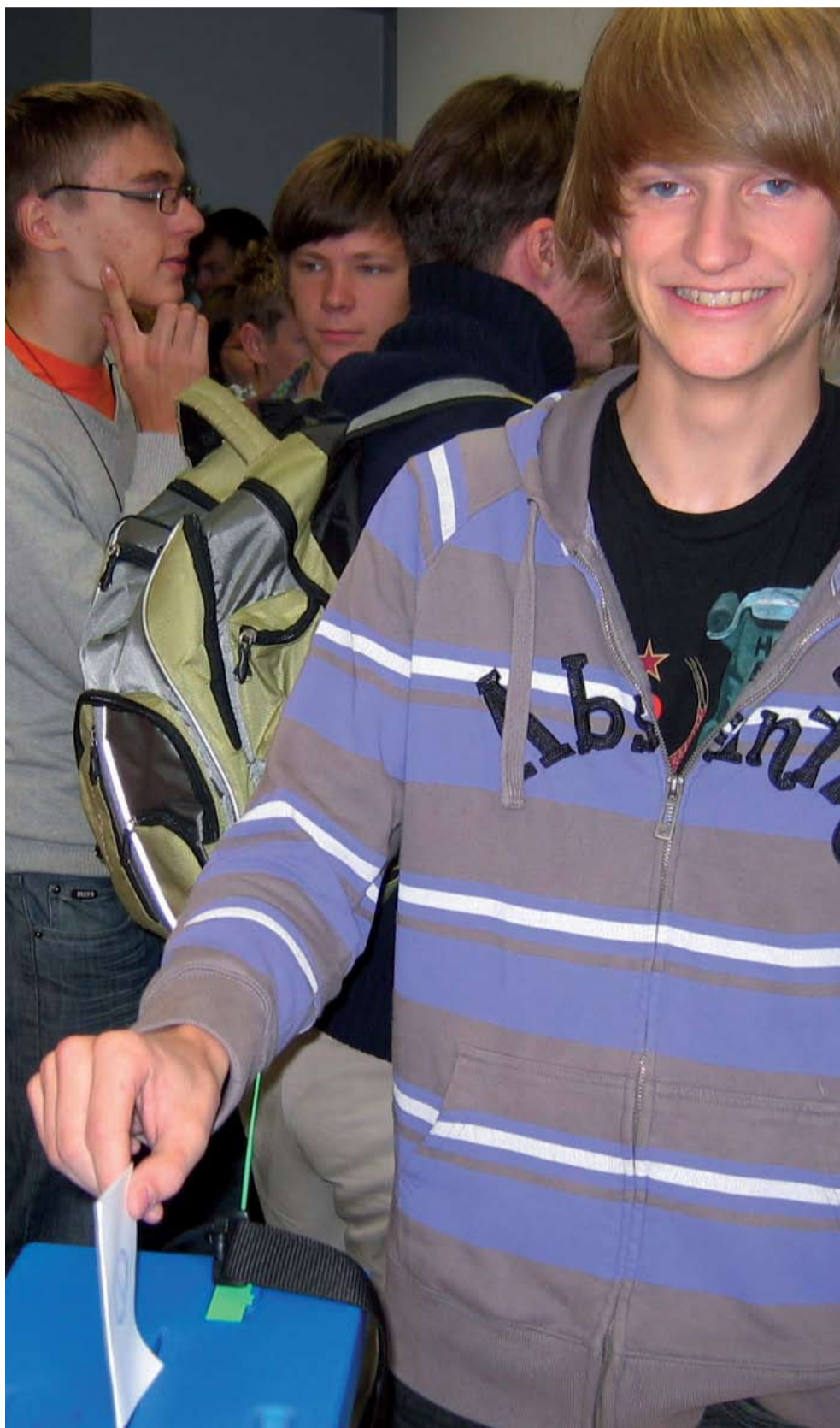
Tulevased valijad varivalimistel Tartus Hugo Treffneri Gümnaasiumis

Kuulnud erinevate inimeste käest nende valimiskäimise kogemusi, pean nentima, et valikuid on tehtud nii eelneva kui veelgi ekstreemsemate näidete põhjal. Seega leian, et kui üks inimene esitab juba noores eas küsimuse kanepi ja selle seotuse kohta