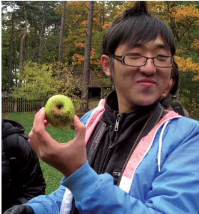
Noortevahetus tõi Eestisse viis hiina üliõpilast.