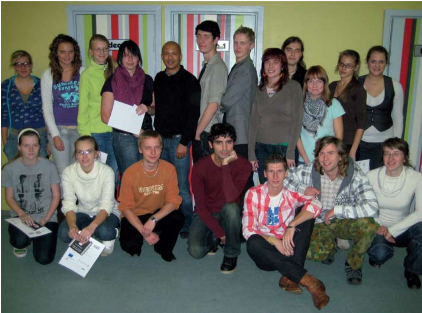
Kahepäevane dokfilmide õppimise töötuba Tartus tõi kohale hulga noori huvilisi

Erlise pärlina oli sel aastal festivalil dokfilmide blokk, kus näidatavad linatööd on valminud Anne noortekeskuse ja MTÜ Mondo koostöös korraldatud lühidokfilmide töötoas. MTÜ Mondo korraldas vahetult enne festivali lisaks Tartule töötoa ka Narvas. Eesmärk on töötubadega jõuda noorteni Eesti eri paigus. „Dokfilm on võimas vahend oma mõtete ja arvamuste väljendamiseks. Noored nägid, kui aeganõudev on kõigest viieminutilise dokfilmide tegemine,” lausub pro-