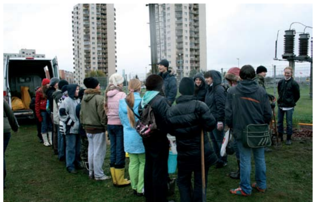
Lasnamäe puuistutamise talgutel oli kohal palju nii eesti kui vene noori.