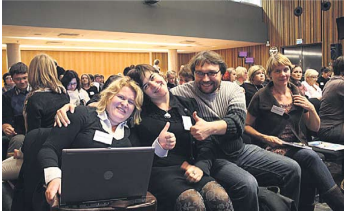
Foorum tõi kokku nii noorsootöötajad kui ka noortega või noorteühendustega kokku puutuvaid inimesi.

Foorumil osalesid nii noorsootöötajad kui ka kõik noortega või noorteühendustega kokku puutuvad inimesed.