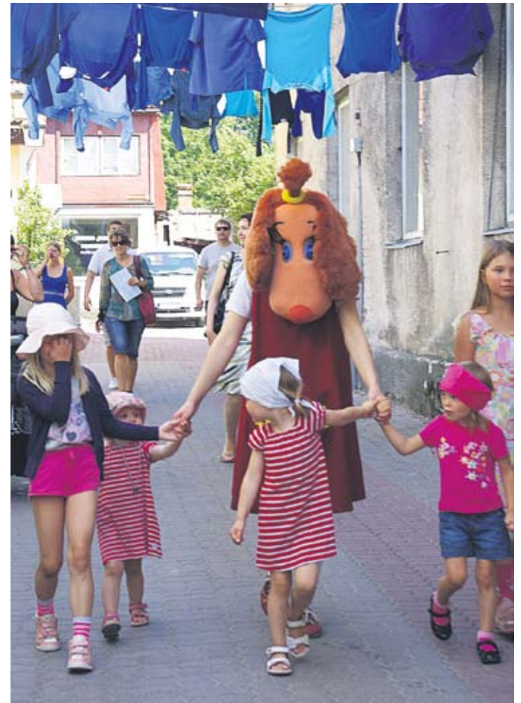
UNICEFi sinise nädala ajal võis Pärnus kohata Lottet.

MTÜ Oti Ralliklubi on Kärjal loodud noormeeste suunatud huviring, mis on poiste seas väga populaarne. „Oti ralliklubi, mis on nime saanud kuulsalt rallisõitjalt Ott Tänaku järgi, köitis meie tähelepanu, sest spetsiaalselt noormeeste suunatud huviringe ei teguts