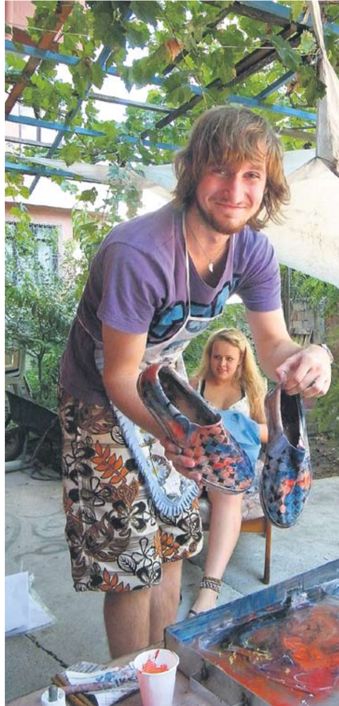
Veega joonistamine „Erbu kunst“ lasteaias.