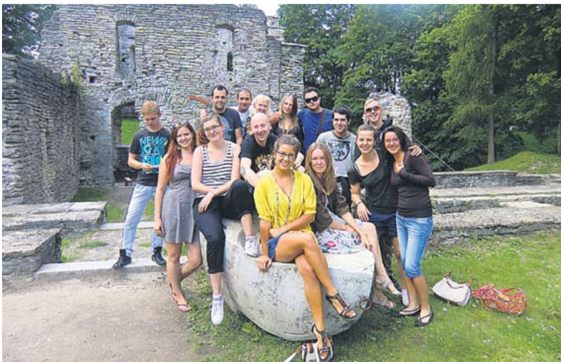
Järvamaa laagrilised tutvumas vabatahtlikkuse rolli ja võimalustega.