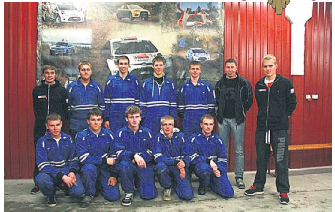
Oti Ralliklubi on üks väheseid poistele suunatud huviringe.