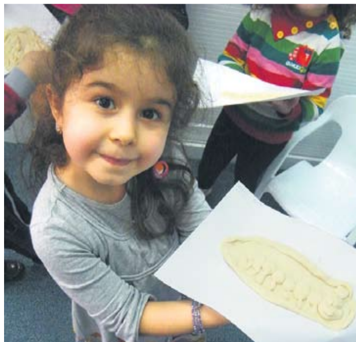
Taignast voolimine lasteaias.